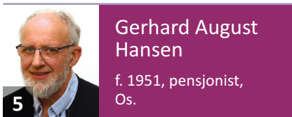
Gerhard August Hansen